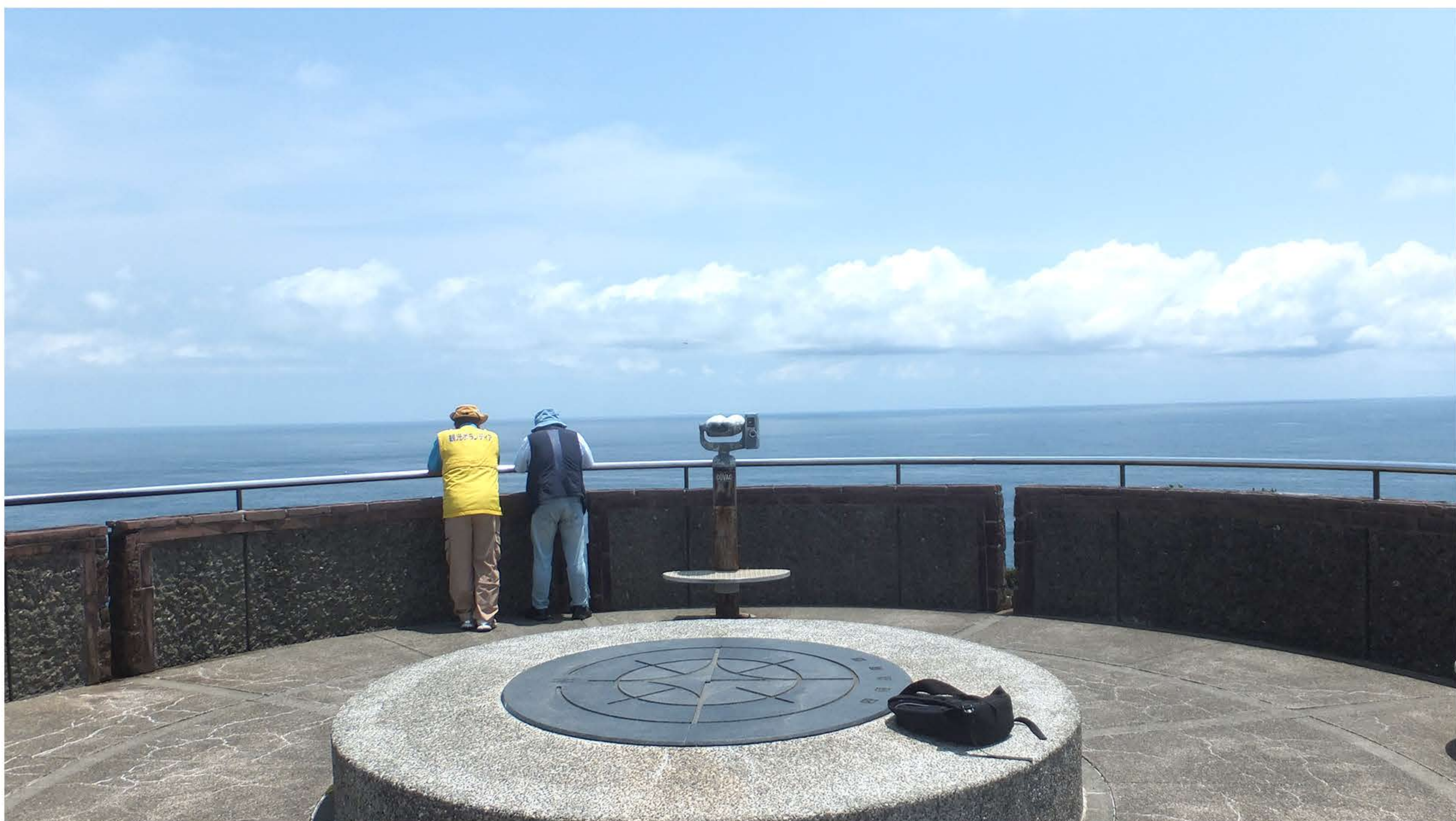
入口有旅客服務中心，從服務中心到展望台約3分鐘。